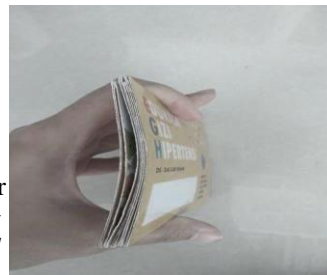
Gambar zig-zag remind